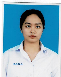
กรรมการนักเรียน