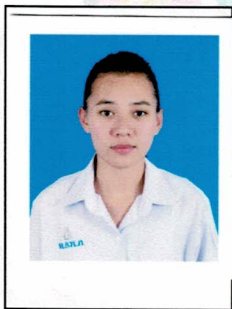
เหรียญฉีก