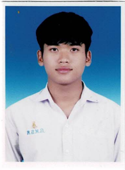
ประธานคณะกรรมการนักเรียน