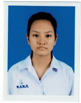
รองประธานฝ่ายงบประมาณ