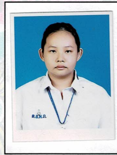
เลขานุการ