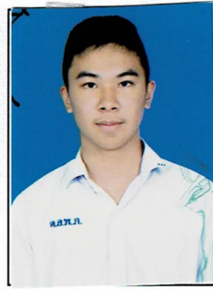
รองประธานฝ่ายบุคคล