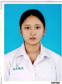
เลขานุการ