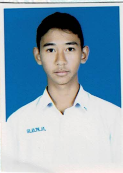
กรรมการนักเรียน