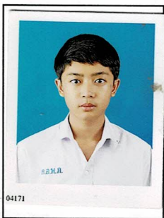
กรรมการนักเรียน