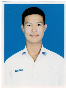
ประธานคณะกรรมการนักเรียน