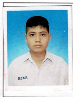
กรรมการนักเรียน