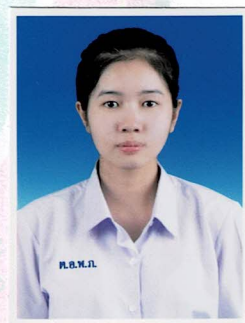
กรรมการนักเรียน