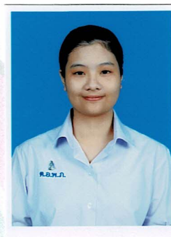
เลขานุการ