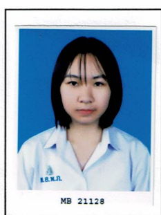
กรรมการนักเรียน