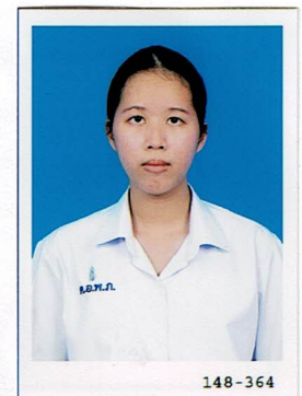
กรรมการนักเรียน