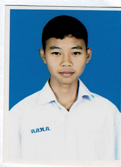
กรรมการนักเรียน