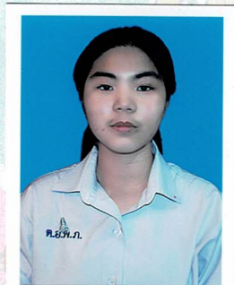
ประชาสัมพันธ์