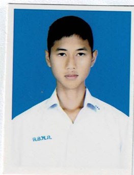
กรรมการนักเรียน