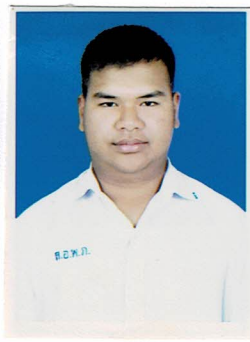
รองประธานฝ่ายวบุคคล