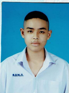
ประชาสัมพันธ์