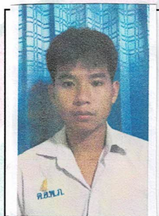
รองประธานฝ่ายกิจกรรมพิเศษ