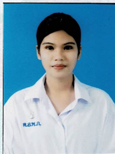
รองประธานฝ่ายกิจกรรมพิเศษ