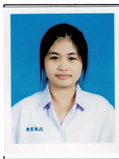
รองประธานฝ่ายวบุคคล