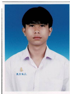
กรรมการนักเรียน