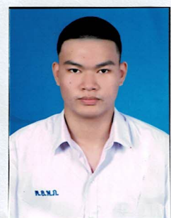
กรรมการนักเรียน