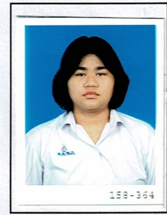
รองประธานฝ่ายงบประมาณ