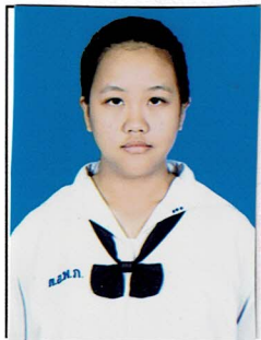
รองประธานฝ่ายทั่วไป