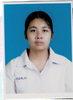
รองประธานฝ่ายกิจกรรมพิเศษ