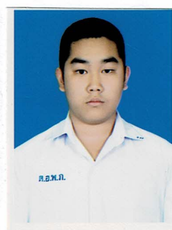
กรรมการนักเรียน