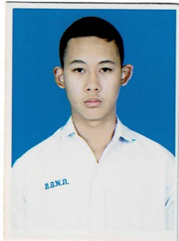
รองประธานฝ่ายทั่วไป