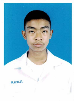
รองประธานฝ่ายงบประมาณ