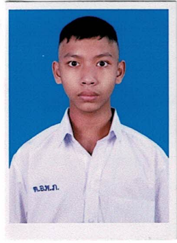
รองประธานฝ่ายวิชาการ