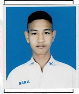
เลขานุการ