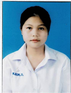
รองประธานฝ่ายทั่วไป