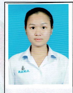
เลขานุการ