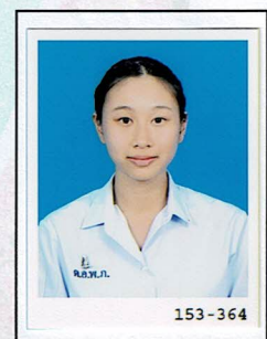
กรรมการนักเรียน