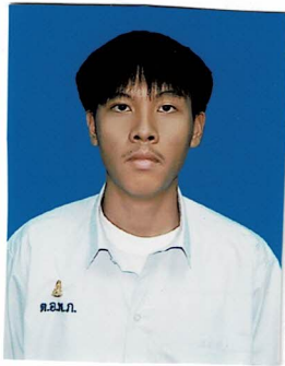
รองประธานฝ่ายวิชาการ