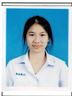
รองประธานฝ่ายทั่วไป