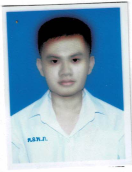
ประธานคณะกรรมการนักเรียน