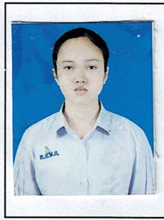
รองประธานฝ่ายวิชาการ