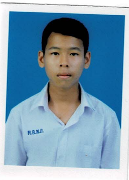
กรรมการนักเรียน