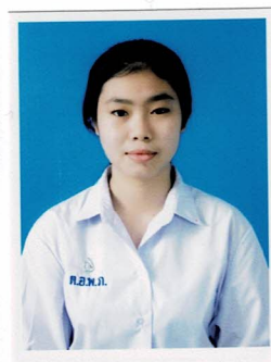
รองประธานฝ่ายงบประมาณ