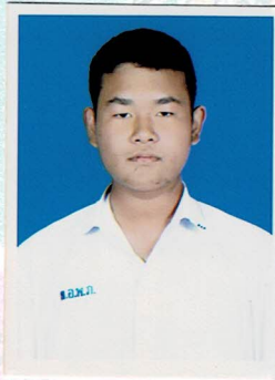
ประชาสัมพันธ์