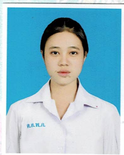
ประชาสัมพันธ์