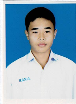
รองประธานฝ่ายบุคคล