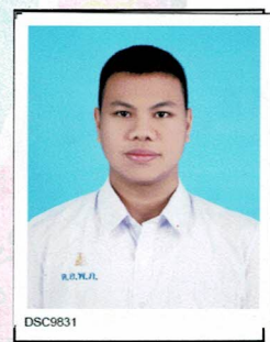
กรรมการนักเรียน