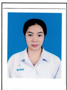
กรรมการนักเรียน