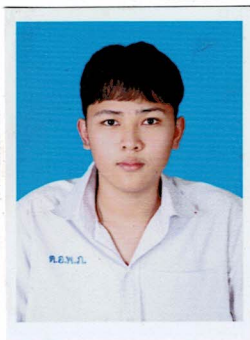
กรรมการนักเรียน