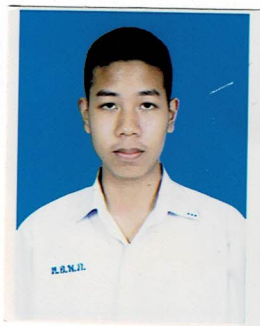
รองประธานฝ่ายวิชาการ