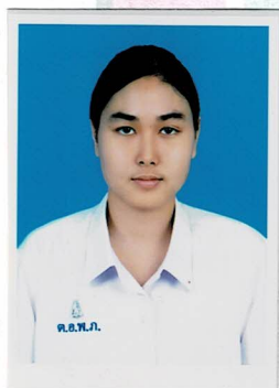
เหรัญญิก