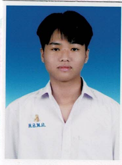
รองประธานฝ่ายกิจกรรมพิเศษ