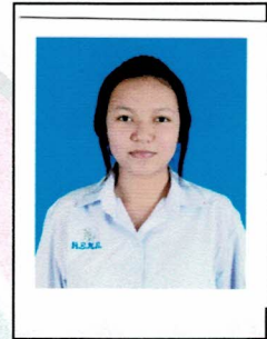
เลขานุการ