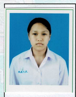
กรรมการนักเรียน