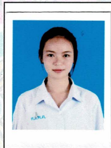
เลขานุการ