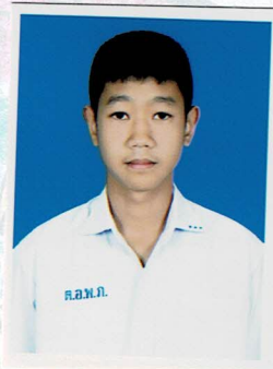
เลขานุการ