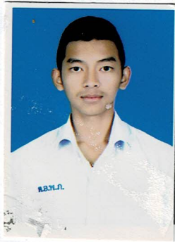
ประธานคณะกรรมการนักเรียน