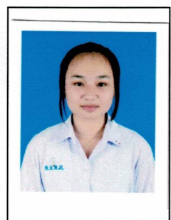
กรรมการนักเรียน