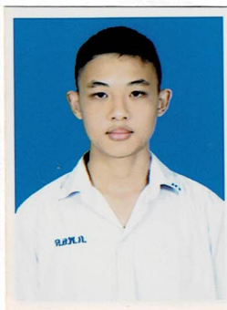
กรรมการนักเรียน